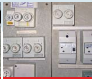
Elektrokasten aus Asbestzementplatten