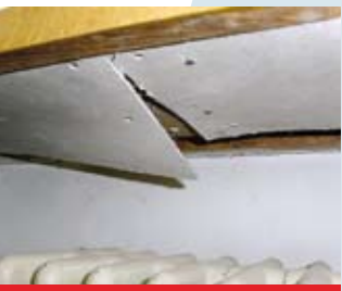
asbesthaltige Leichtbauplatten (Brandschutz)

Wichtig ist das Erkennen von asbesthaltiger Bausubstanz. Asbest kommt nicht nur in Eternitplatten (Dächer, Velounterstände, Elektrokästen, Isolationsplatten, Zementrohre etc.) vor, sondern auch versteckt in Unterlagsböden, Novilon-Belägen, Dichtungsschnüren, Brandschutzplatten etc.