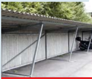
Fahrradunterstand aus Asbestzement