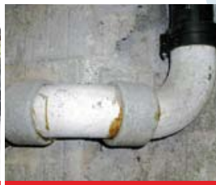
Abwasserleitung aus Asbestzement