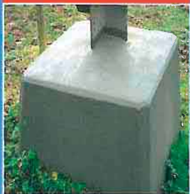
vorher – nächher

LEBAG ZÄHLT SEIT ÜBER 50 JAHREN ZU DEN FÜHRENDEN UNTERNEHMEN IM FREILEITUNGS- UND ELEKTROBAU. MIT 60 MITARBEITERN IST LEBAG IN DER SCHWEIZ UND MIT EINER NIEDERLASSUNG IN FRANKREICH TÄTIG. DIE VERKEHRSTECHNISCH GÜNSTIGEN, ZENTRALEN LAGEN ERMÖGLICHEN KURZFRISTIGE MONTAGEEINSÄTZE UND SCHNELLE INTERVENTIONEN AUF BAUSTELLEN IN DER GANZEN SCHWEIZ UND IN FRANKREICH.