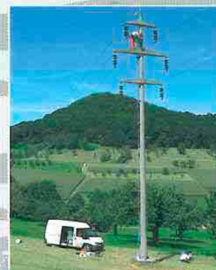
Die Montagecrew im Einsatzwagen vor Ort