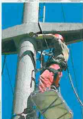
Instandsetzung eines Betonmastes ...